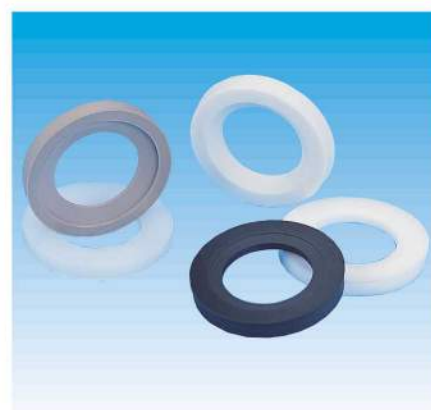
Divers matériaux de sièges Different seats material