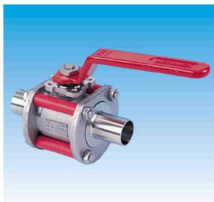
Soudure orbitale Orbital welding