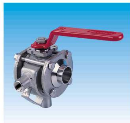
Enveloppe thermique Steam jacket