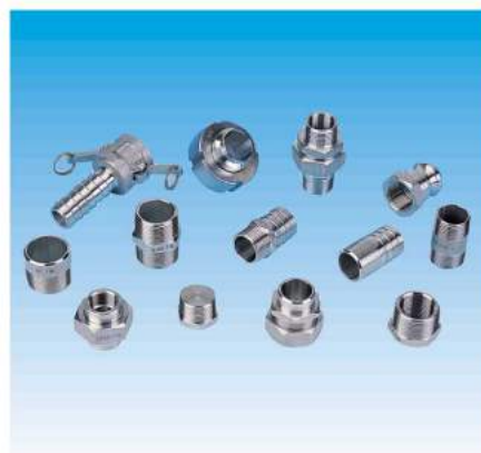
Raccords et accessoires inox Stainless steel fittings