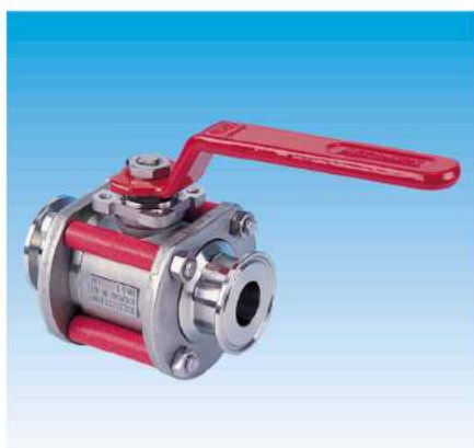
Raccords clamp Clamp ends