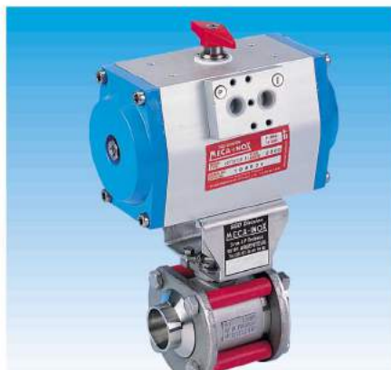
Motorisation, signalisation Valve actuation