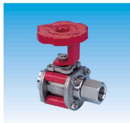
Raccords pour manomètre/raccords à bagues Connection for manometer/compression fittings