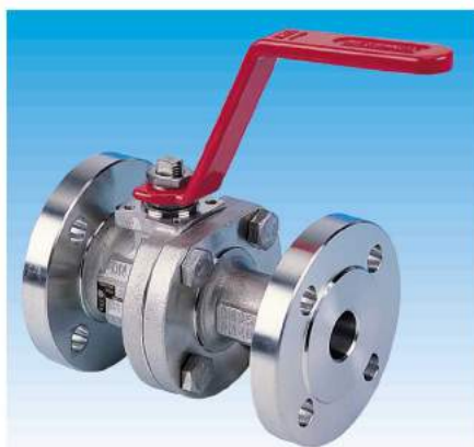
2 pieces DIN/ANSI DIN/ANSI Flanged