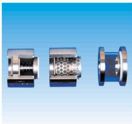
Clapet, filtre, viseur Check valve, filter, sight glass