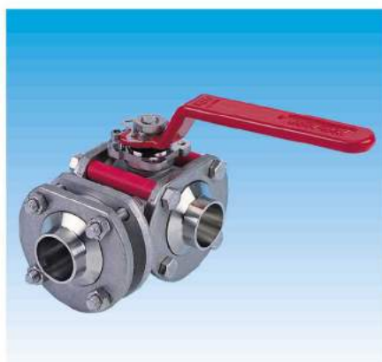
3 voies 3 ways